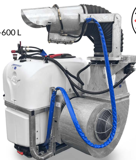
OLIVIA FLEXI APTL-F 300-400-500-600 L