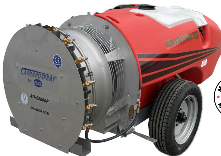
FRONT CLEAN JET ATI-EX 600-700-800 L