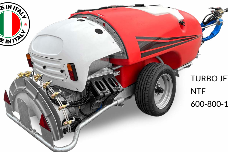
TURBO JET NTF 600-800-1000 L