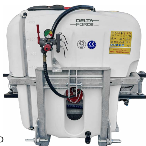
FIELD PRO GC-BD 400-600-800-1000 L