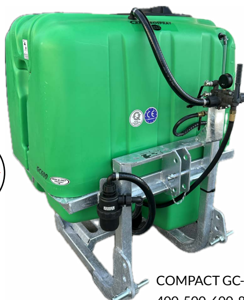
COMPACT GC-S 400-500-600-800-1000 L