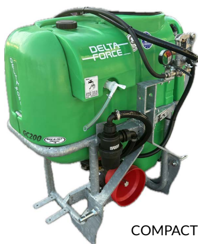
COMPACT GC-S 200-300 L