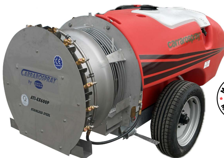
FRONT CLEAN JET ATI-EX 600-700-800 L