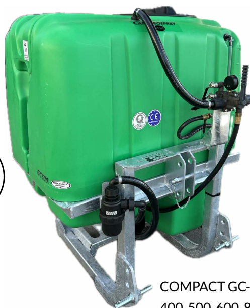
COMPACT GC-S 400-500-600-800-1000 L