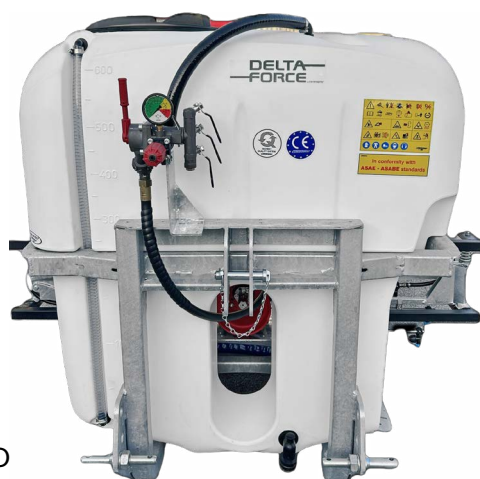
FIELD PRO GC-BD 400-600-800-1000 L