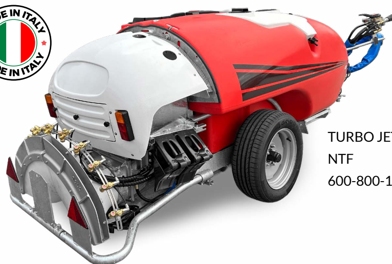
TURBO JET NTF 600-800-1000 L