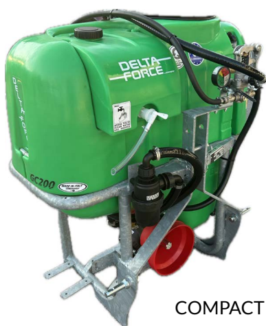
COMPACT GC-S 200-300 L