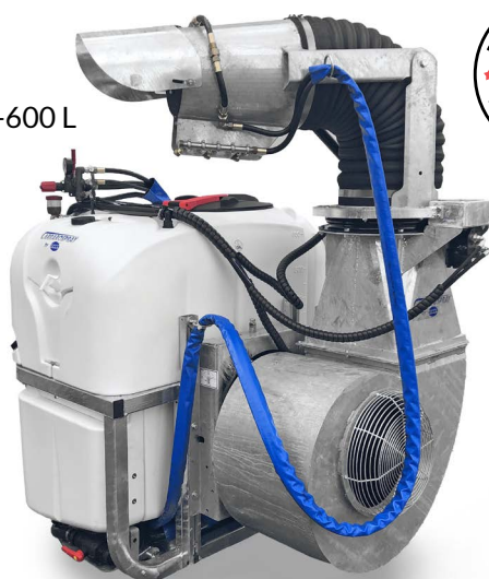
OLIVIA FLEXI APTL-F 300-400-500-600 L