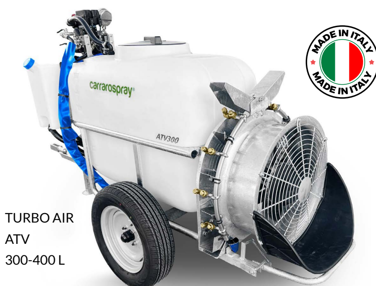
TURBO AIR ATV 300-400 L